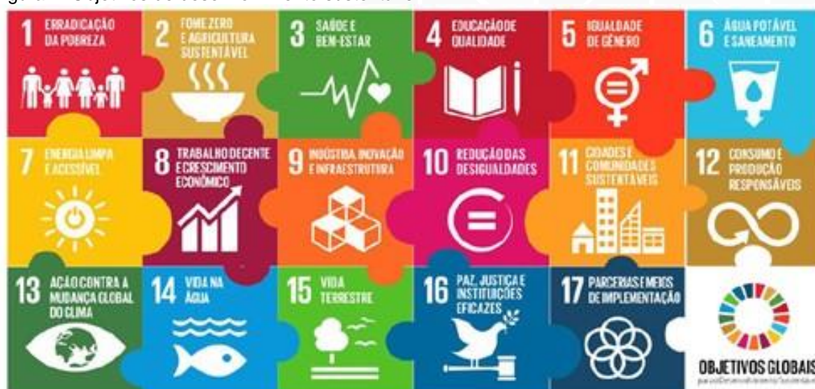
Figura 1: Objetivos de desenvolvimento sustentável

Os 193 países-membros das Nações Unidas adotaram oficialmente a nova agenda de desenvolvimento sustentável, intitulada “Transformando nosso mundo: A agenda 2030 para o desenvolvimento sustentável”, na cúpula de desenvolvimento sustentável, realizada na sede da ONU em Nova York, em setembro de 2015. Essa agenda contém 17 objetivos e 169 metas (Figura 1):